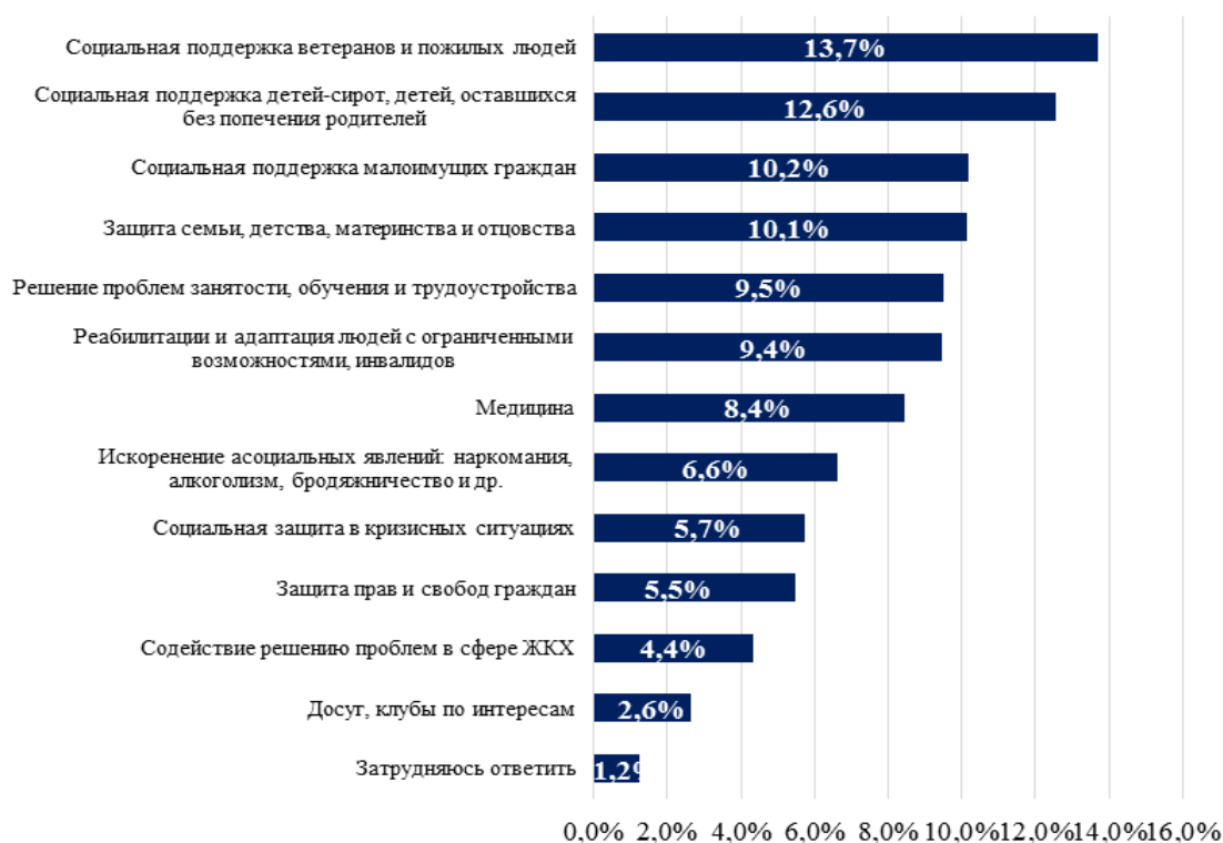
Рис. 2. Приоритетные направления в деятельности СО НКО в Чувашской Республике по мнению населения (по данным исследований Семедовой-Полупан Н.Г.; Сергеевой Н.В. и Сергеева Д.В.) 9

Таким образом, данные официальной статистики и данные, представленные в научных исследованиях по приоритетным направлениям деятельности СО НКО в Чувашской Республике, соотносятся между собой. В отличие от мнения населения, которое считает приоритетными направлениями деятельности СО НКО в республике другие направления